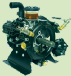
OMEGA 135 (137 L/mn, 50 bar)

9 palas 42,5 m/s 64.440 m 3 /h 18 jets 51 CV / HP