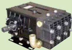
GAMMA 125 (133 L/mn, 50 bar)